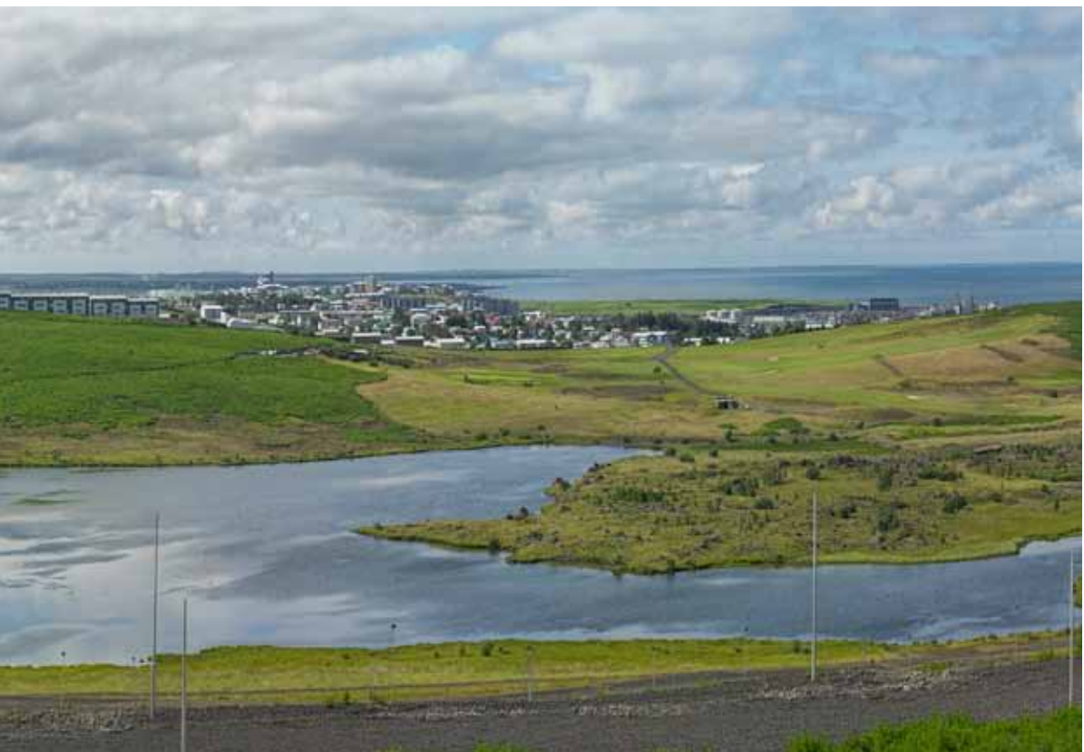
Horft af Urriðaholti yfir Urriðavatn, Hafnarfjörð, Reykjanes og Faxaflóa

Sérstakar leiðbeiningar hafa verið gefnar út fyrir húsbyggjendur, verktaka og íbúa í Urriðaholti um hvernig best er að tryggja vatnsbúskap Urriðavatns og viðhalda gæðum þess. Leiðbeiningarnar má nálgast á skrifstofum Garðabæjar og Urriðaholts ehf, svo og á vefsíðum þeirra.