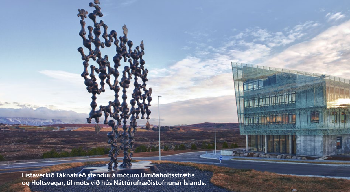
Listaverkið Táknafréð stendur á mótum Urriðaholtsstrætis og Holtsvegjar, til móts við hús Náttúrufræðistofnunar Íslands.